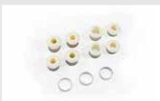
Adapter Set Mountainbike adapter set mountainbike