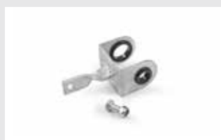
Lefty-Adapter lefty adapter