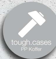
tough.cases PP Koffer