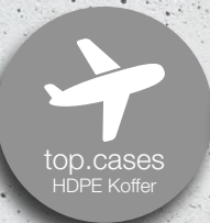
top.cases HDPE Koffer